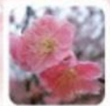
おしどりの名が由来 1枝に実が2つ