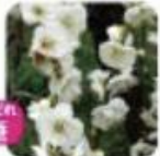
白と緑のコントラストが綺麗