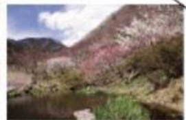
池に映る白梅・紅梅の眺め