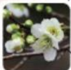
長く緑色の萼が特長