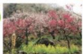
菜の花と梅の競演。梅のアーチ