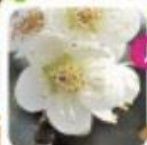
香りが強く蕾がモスグリーン