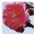
鮮やかな紅色が美しく植木で人気