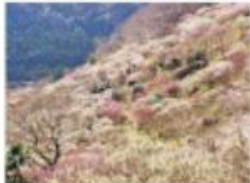
梅林最高地点からの眺め