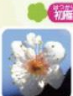
早い時期から咲く